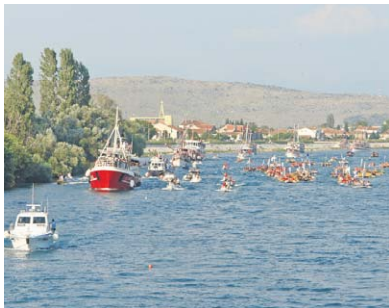
... no oko veletržnice na izlazu iz Metkovića već se najbrži počinju izdvajati. Između brodova i lađa plove gliseri sa sucima.