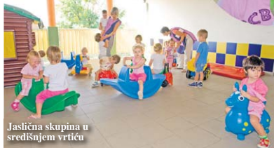
Jaslična skupina u središnjem vrtiću