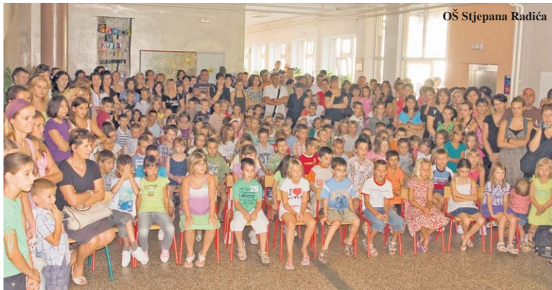
OŠ Stjepana Radića

Mi smo posjetili obje škole i načinili dvije fotografije prvaša.