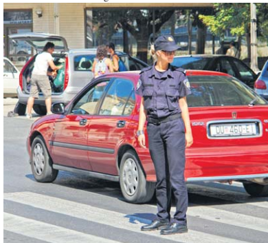
Ovoga ljeta učenici policijske akademije odrađivali su praksu na ulicama Metkovića

zonama kod škola. Policija još jednom apelira na sve vozače da obrate pozornost na djecu i to ne samo u blizini škola, već i na svim mjestima gdje se djeca kreću.