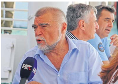
Na zapovjednom brodu Palagruža predsjednik RH Stjepan Mesić strpljivo odgovara na novinarska pitanja.