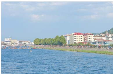
Nekoliko stotina metara od mosta lađari još uvijek vesla u zbijenoj skupini...