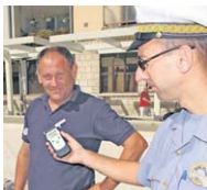
Instrument je pokazao 0,00 promija

Iako je akcija ponajprije preventivnog karaktera, poduzimaju se da će se tijekom njenog trajanja poduzeti i represivne mjere prema vozačima koji ne poštuju prednost pješaka na obilježenim pješačkim prijelazima, sankcionirati vozači koji su nepropisno parkirali i zaustavili svoja vozila u zonama škola, ali i pojačati kontrola brzine kretanja vozila upravo u