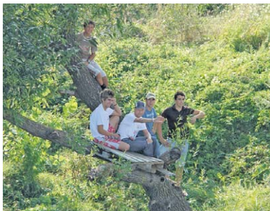
Jerkovačka ekipa visoko na stablu iznad Neretve očekuje prolaz svojih favorita.