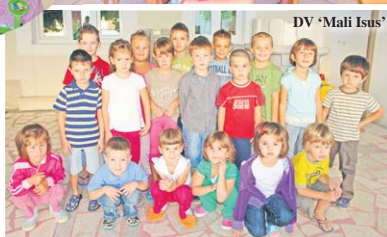
DV 'Mali Isus'