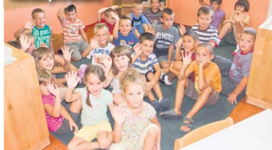
Središnji vrtić - skupina veterana predškolaca