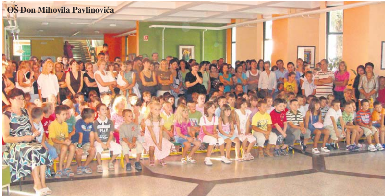
OŠ Don Mihovila Pavlinovića