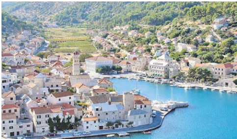
Da veze između Metkovića i Brača postoje dokaz je i krasna kamena građevina škole u Pučišćima (u sredini fotografije) koju je obnovila i dogradila metkovska firma MGA

No, nisu bračko-neretvanske veze od jučer. Brač je u srednjovjekovlju bio dijelom Neretvanske kneževine, a nakon turskih osvajanja postao je utočištem brojnih izbjeglica s kopna, među kojima je bilo i dosta Neretvana. Turska su osvajanja dovela od takvih pomicanja stanovništva da bi se ugrubo moglo reći da pravi Neretvani danas žive na otocima i preko mora (u Moliseu i BiH), a ono stanovništvo koje se danas smatra starosjedačkim u Neretvi uglavnom je pristiglo u neko-