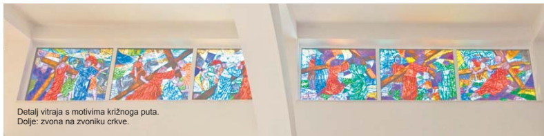
Detalj vitraja s motivima križnoga puta. Dolje: zvana na zvoniku crkve.